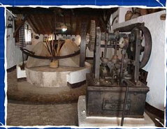
CORTIJO EL PULGARÍN BAJO. ALFARNATEJO